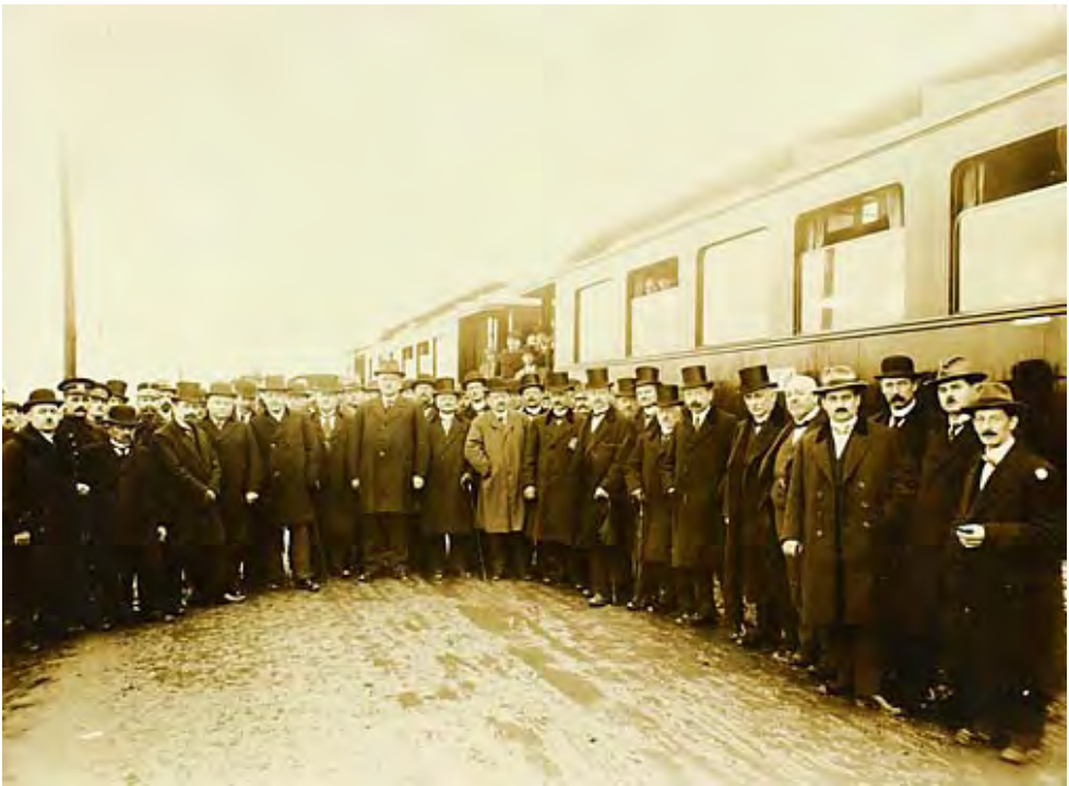
De opening van de spoorlijn Eindhoven-Weert in 1913.

Een eerste aanzet daartoe was reeds gegeven in de periode 1900-1940. Deze vooroorlogse periode kan getypeerd worden als een fase uit de economische geschiedenis van Weert, waarin zich de geleidelijke overgang van agrarische naar industriële samenleving voltrok. Een overgang, die enkele decennia later plaatsvond dan in de meer centraal gelegen delen van Nederland en vergezeld ging van enkele vernieuwingen en veranderingen in de Weerder samenleving, die de basis hebben gelegd voor het toekomstige industrialisatieproces: de komst van de gasfabriek en het bankwezen, de oprichting van de Kamer van Koophandel en de opening van de spoorlijn Eindhoven-Weert in 1913. 1 Met name door de opening van genoemde spoorlijn geraakte Weert uit zijn geïsoleerde geografische positie en ontstond een rechtstreekse verbinding met Noord-Brabant en het centrum van Nederland. De weg voor een industriële ontwikkeling stond open en de doorbraak van het tot dan toe nagenoeg uitsluitend agrarisch karakter van de gemeente was nog een kwestie van tijd.