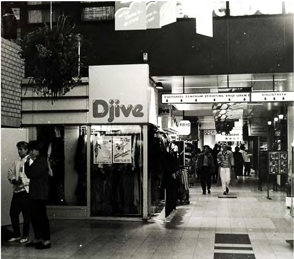
Overdekt winkelcentrum de Munt met daarin sociaal-culturele voorzieningen.

tigingen en bedrijfsuitbreidingen en in navolging van de door de commissie Wagner voorgestane beleidsomgeving, wordt die aandacht - onder gelijktijdige voortzetting van het voorwaardenscheppend beleid - na 1980 in toenemende mate gericht op de mogelijkheden, die er vanuit het gevestigde bedrijfsleven aanwezig zijn voor nieuwe of afgeleide activiteiten, die kunnen bijdragen aan een versterking van de economische structuur en de werkgelegenheidssituatie. Deze beleidsomgeving leidde tot een verruiming van de taakstelling van de lokale overheid: het volgen van bedrijfseconomische ontwikkelingen in ondernemingen, het vroegtijdig signaleren van mogelijke knelpunten of initiatieven en het aanbieden van mogelijkheden ter advisering en/of bemiddeling, m.a.w. een meer dienstverlenende en intermediaire rol van de lokale overheid naar het bedrijfsleven.